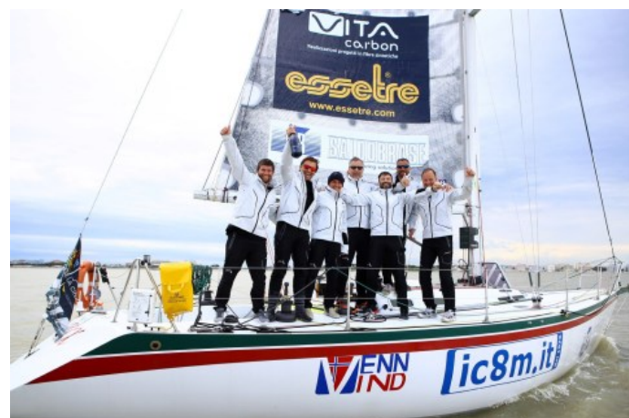
Trofeo Pellegrini nella classe X2 vince Crazy e in XTutti trionfa Super Atax