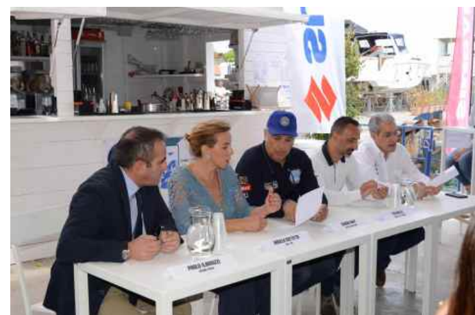
Al White Club di Palermo, la conferenza stampa della Ice Rib Challenge