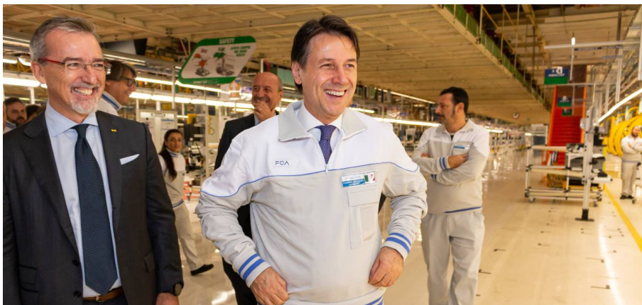
Premier Conte con felpa Fca allo stabilimento di Mirafiori

Oggi Cda Banca Intesa Sanpaolo per il prestito da 6,3 miliardi a Fca: le polemiche, i dividendi e il rilancio dell'automotive. Poi l'ok dovrà arrivare anche da Sace e Governo